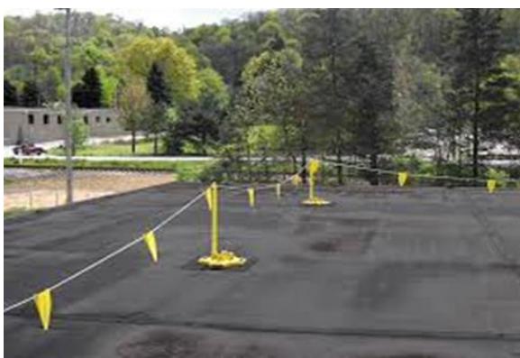
Voorbeelden van waarschuwingslijnen op een licht hellend dak