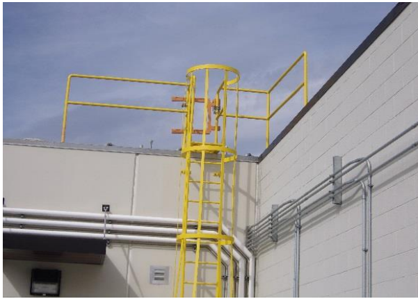
Een voorbeeld van een vaste ladder voor betreding van een dak

Gebruik een waarschuwbord of barricade op de grond om ongeautoriseerd gebruik van de toegangsroute te voorkomen, bijvoorbeeld d.m.v. een bord met de tekst " Alleen Bevoegd Personeel ". Veiligwerkvergunning of procedure verplicht ". Het plaatsen van kettingen of hekken met sloten erop zou een extra bescherming laag bieden.