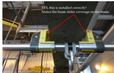
Balkklemmen, hier bevestigd aan constructiestaal