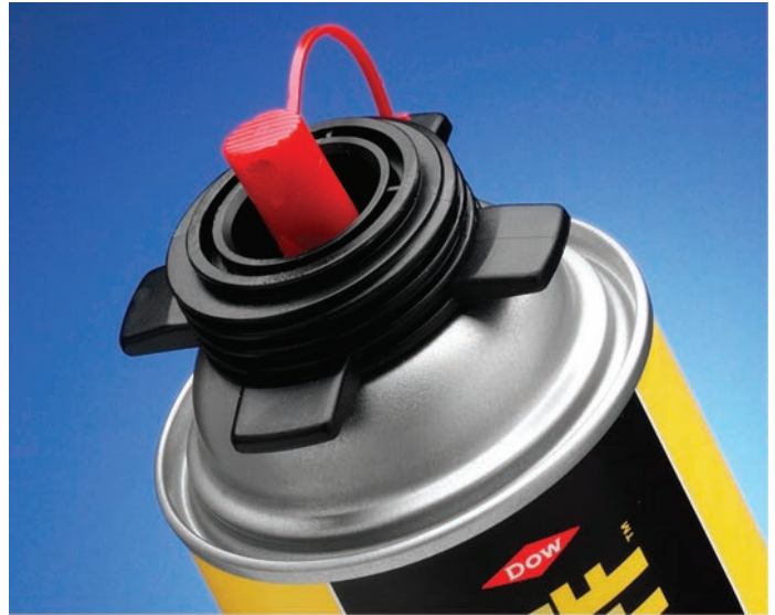
Limpiador con la boquilla de atomización roja colocada.

Frote la punta del tambor contra una madera suave para quitar toda la espuma. Nunca utilice un objeto filoso para limpiar la punta del tambor. Esto puede dañar la punta y el vástago interno, y generar filtraciones en la pistola.