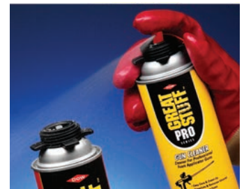
Elimine la espuma no curada del adaptador de la pistola o lata.