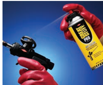
Elimine la espuma no curada de la pistola.