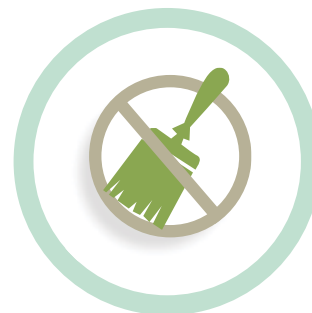
No usar pincel